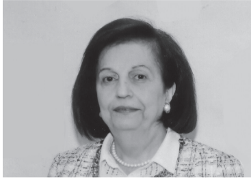
ԱՋՆԻԻ ԳԱՐԱԼԵՔԵԱՆ ՄԻՔԱՅԷԼԵԱՆ