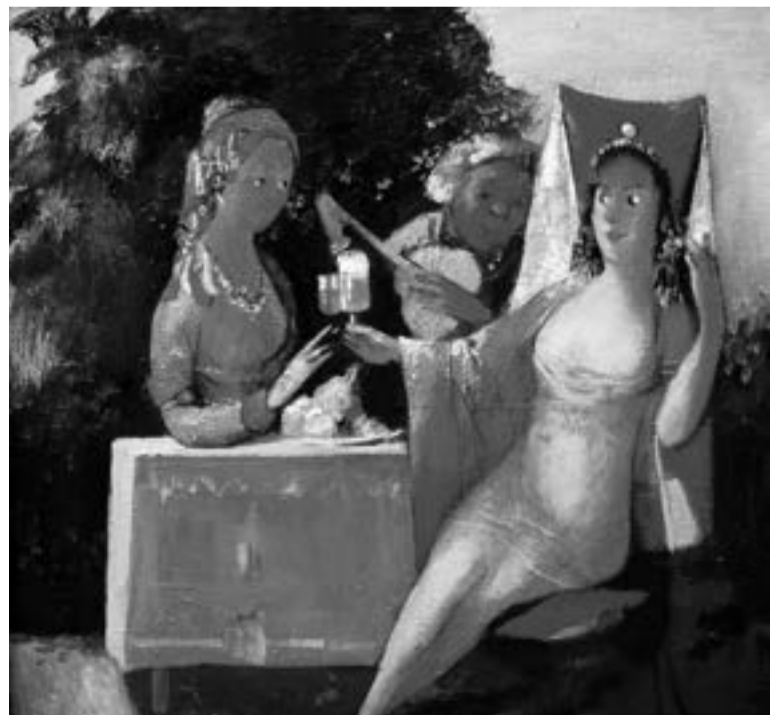
Գործ՝ Դանբարձում Դուկասյանի