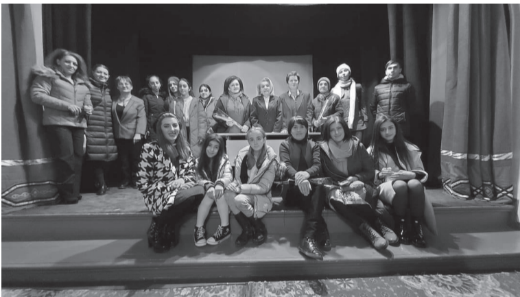
ՀԱՆԴԻՊՈՒՄ ԱՐԶԱԿԱԳՐԻ ՀԵՏ