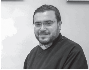
ԽՈՐԷՆ ԶՅՆՅ ՊԵՐԹԻՉԼԵԱՆ ՀԱԼԷՊ -ՍՈՒՐԻԱ